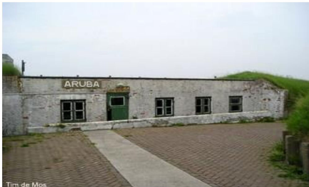
Oude werkplaats van de Geschutmaker op het zeefront

Deze gegevens kunt u invullen op uw opgaveformulier op onze website.