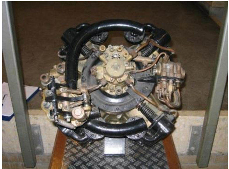
Motor MK 8 Torpedo

Nieuwe leden kunnen zich bij onze reünie aanmelden of andere informatie krijgen via een E-mailtje naar onze secretaris. Zie hiervoor onderstaande contactgegevens.